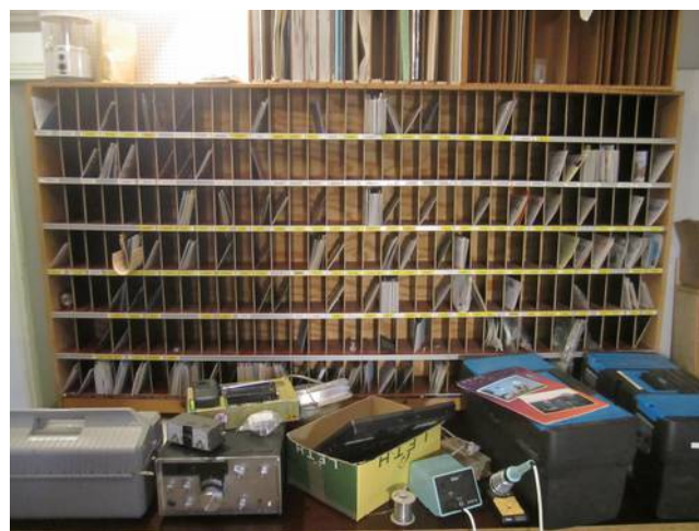
Kuva: Kerhon tulevien QSL-korttien lokerikko, aina melkein täynnä!