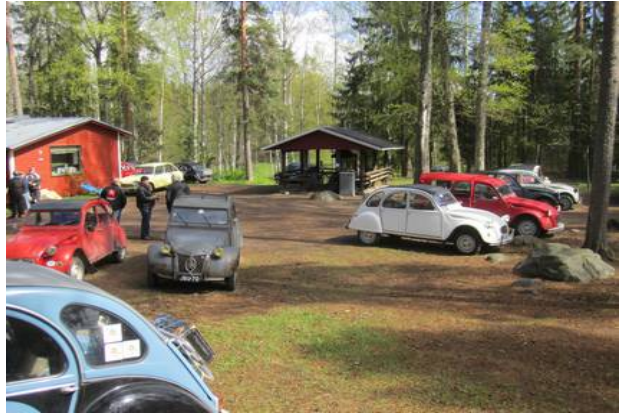
Kuva: Rättisitikka poikineen 2CV Hyrinä- tapaamisessa.

Rättäriaatteeseen voi tutustua Suomen CV-killan ry:n kotisivuilta http://www.2cv.fi/