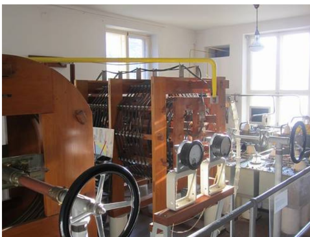
Kuva: Museon antennihuone vastavalossa