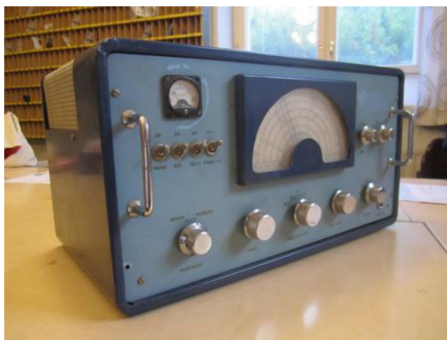
Kuva: Kerho sai lahjoituksena 1950-luvulta olevan RP-62 vastaanottimen. Hieno kapistus!

Museon äkillisen remontin vuoksi koululaisesittelyitä ei vuonna 2015 järjestetty.